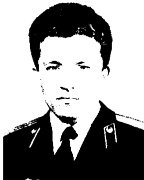
ШЕВЕЛЕВ Николай Николаевич (1965–2000)

50 лет со дня рождения участника 2-й Чеченской кампании, Героя Российской Федерации