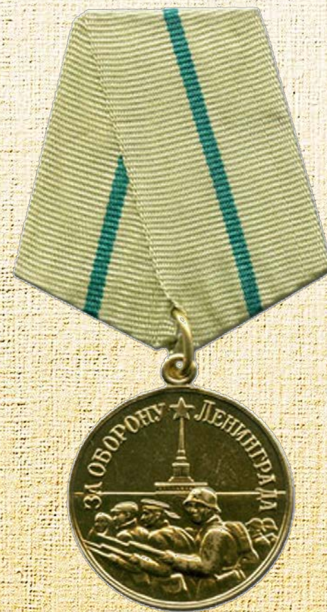
«За оборону Ленинграда»

Военнослужащие частей, соединений и учреждений Красной армии и Военно-Морского флота и войск НКВД, рабочие, служащие и другие лица из гражданского населения, содействовавшие обороне города своей работой, награждались медалью «За оборону Ленинграда». Она была учреждена Указом Президиума Верховного Совета СССР 22 декабря 1942 г. Награду получили около 1 млн 470 тыс. человек.