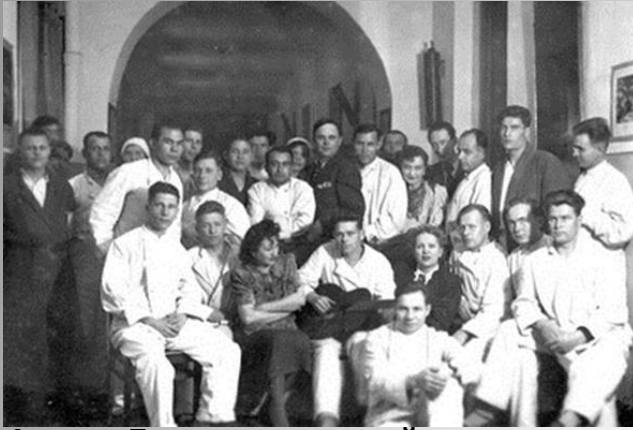
Артисты Театра музыкальной комедии в госпитале после концерта.

Подвигу ленинградцев посвящено огромное количество музыкальных произведений. Среди них и песни о мужестве, стойкости и героизме города на Неве. Свою лепту в общую победу внесли все: от рабочего за станком до музыкантов и композиторов, своим творчеством укреплявшим стойкость и дух горожан.