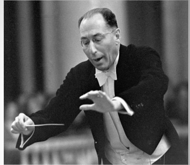
Дирижёр К. И. Элиасберг