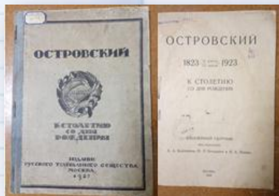
Юбилейный сборник, изданный к 100-летию А. Н. Островского (1923)