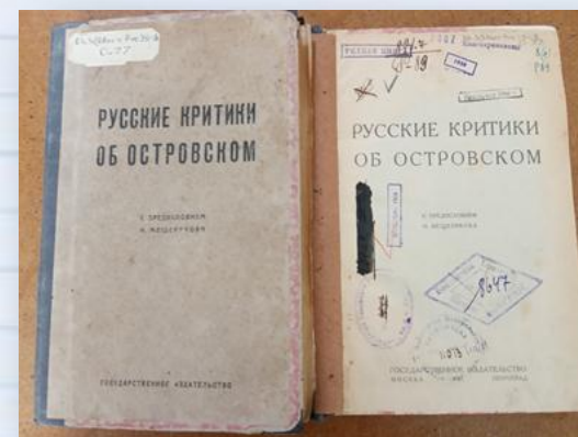
Сборник «Русские критики об Островском» (1923)