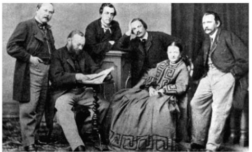
А. Н. Островский и артисты Малого театра: Ф. А. Бурдин, А. А. Нильский, И. Ф. Горбунов, К. Н. Полтавцев, Л. П. Никулина-Косицкая.

Самая известная из них – «Гроза». Этой пьесе известный литературный критик Н. А. Добролюбов посвятил статью «Луч света в темном царстве». Образ Катерины из драмы «Гроза» Островский писал с актрисы Любови Павловны Косицкой. В рукописи напротив монолога Катерины есть пометка писателя: «Слышал от Л. П. про такой же сон».