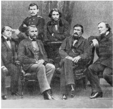
Группа сотрудников журнала «Современник»: И. А. Гончаров, Л. Н. Толстой, И. С. Тургенев, Д. В. Григорович, А. В. Дружинин, А. Н. Островский.

➤ По приглашению Н. А. Некрасова с 1856 года Островский – постоянный сотрудник журнала «Современник», где публиковались его новые пьесы.