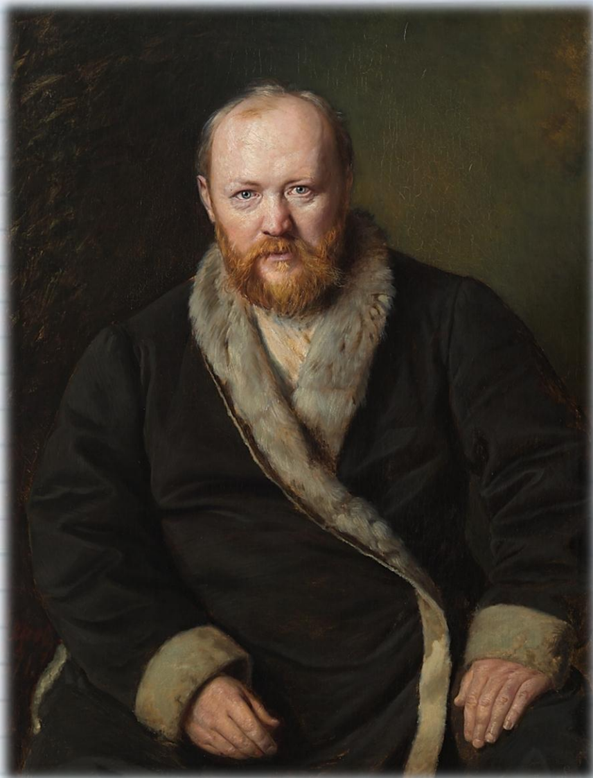
В. Г. Перов. Портрет А. Н. Островского. 1871.