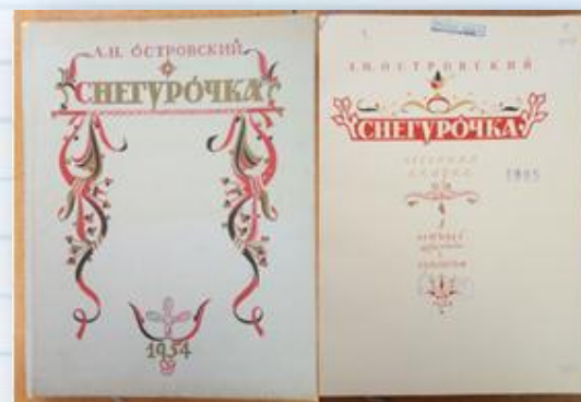
А. Н. Островский. «Снегурочка» (1954)

Материал подготовили: текст – Крутикова Л. М. (зав. сектором); оформление – Чалукян Н. А. (гл. библиотекарь).