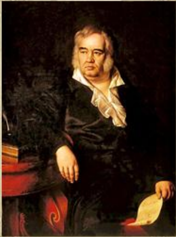
Иван Андреевич Крылов. Портрет работы И. Е. Эггинка. 1834.

(2 [13] февраля 1769, Москва – 9 [21] ноября 1844, Санкт-Петербург)