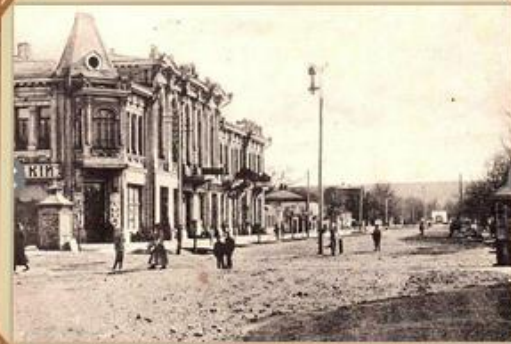
Дом Д. И. Зинковецкого