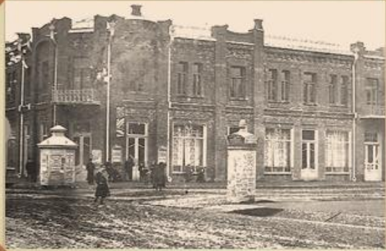
Торговый дом Каплановых