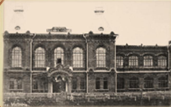
Реальное Алексеевское училище