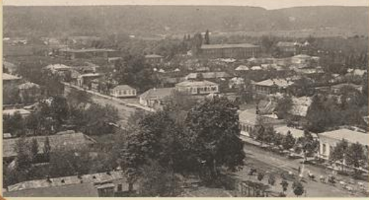
Майкоп. Начало XX века