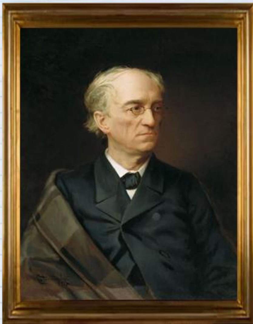
Александровский С. Ф. Портрет поэта Ф. И. Тютчева. 1876. Из коллекции Третьяковской галереи.