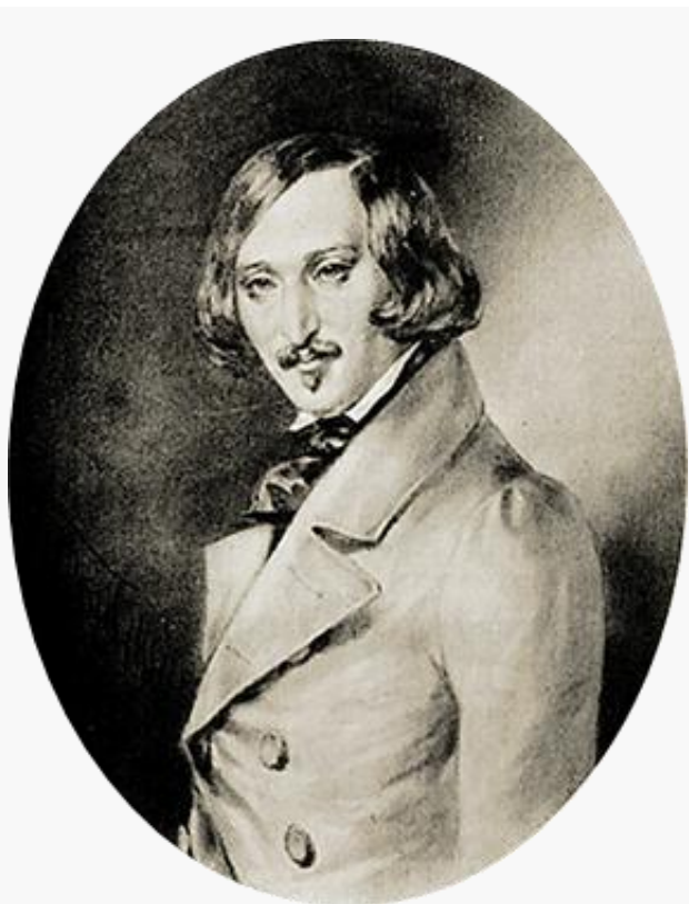
Н. В. ГОГОЛЬ. Художник П. М. Боклевский. 1872 г.