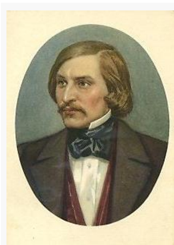
Н. В. ГОГОЛЬ. Открытка с репродукцией работы художника С. Бондара. 1955 г.

«Гоголь поражает нас разносторонностью своего художественного дарования и глубиной поэтического гения. Он был и великий мастер в области искусства образного, и великий поэт-лирик, и великий художник-юморист. И то, что говорил он языком художественных образов, лирики и юмора, почти всегда было и ново, и интересно, и содержательно, и значительно. Но когда он от этого „языка“ переходил к языку прозы, его мысль в большинстве случаев оказывалась бледной, беспомощной, слабой. Он сам признавал это. После неудачи с книгой „Выбранные места из переписки с друзьями“, он написал Жуковскому (22 декабря 1847 г.): „Мое дело – говорить живыми образами, а не рассуждениями. Я должен выставить жизнь лицом, а не трактовать о жизни. Истина очевидная...“» (3, с. 3).