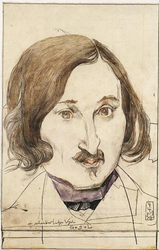
Н. В. ГОГОЛЬ.

Монография Овсяннико-Куликовского „Гоголь в его произведениях“ была опубликована с подзаголовком «К столетию рождения великого писателя. 1809–1909» . В ней автор произносит слова, правоту которых подтвердило время, прошедшее с тех пор: