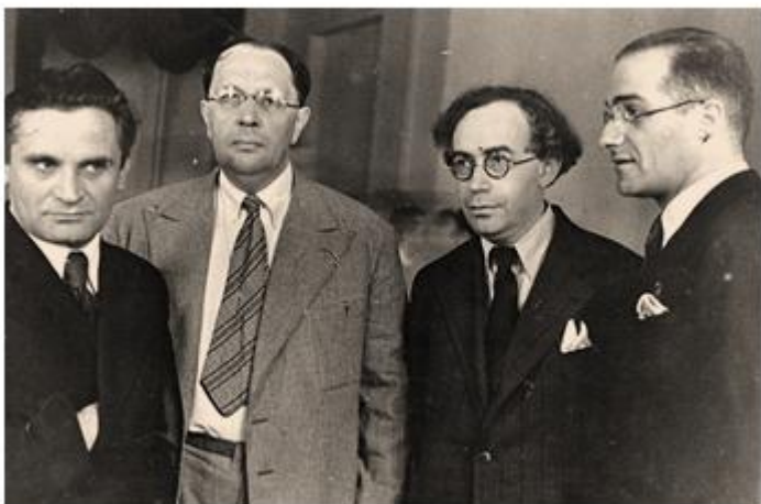
Юрий Олеша на Первом Всесоюзном съезде советских писателей. 1934.

В «Литературной газете» вскоре появляется любопытная заметка. В ней рассказывается о шефстве рабочих над современными писателями. В «подшефной» группе был и Юрий Олеша. Его критиковали на собраниях, просили писать просто и лаконично.