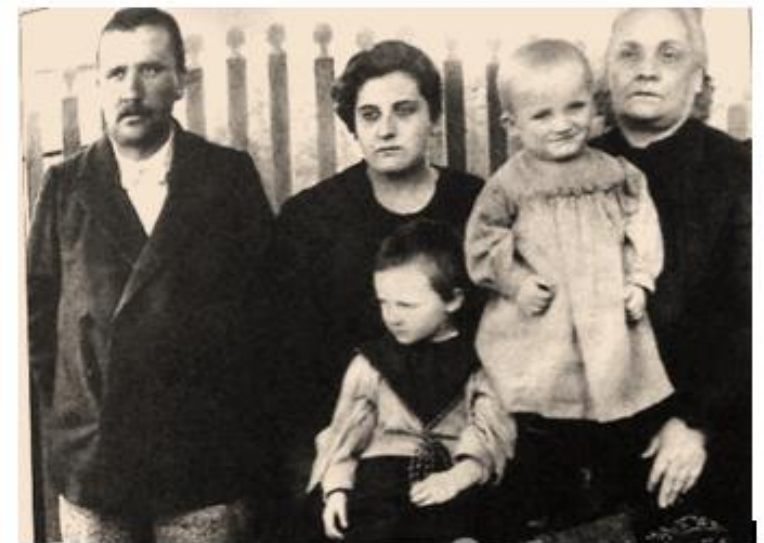
Юрий Олеша с родителями, бабушкой и сестрой. 1902.

Среди близкого круга друзей Юра прослыл остряком, настоящим авторитетом. Метким высказыванием юноша мог заткнуть за пояс любого оппонента. С парнем предпочитали не связываться – никто не хотел стать объектом издевательств.