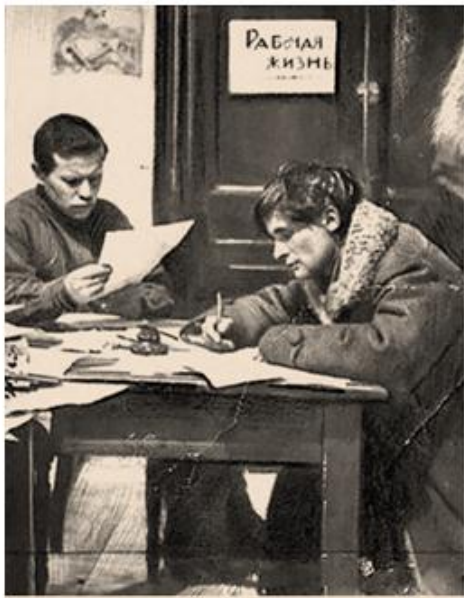
Юрий Олеша (справа) в редакции газеты «Гудок».