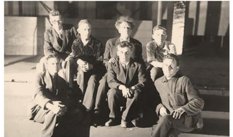
Юрий Олеша (в первом ряду в центре) и группа режиссеров в период постановки спектакля «Список благодеев». 1931.

В 1930 году обстановка в стране была накаленной – последовала череда арестов и репрессий представителей отечественной интеллигенции. Угрозу чувствовали многие писатели и поэты того времени. В этом же году выходит пьеса Юрия Олеша под названием «Список благодеев». Его героиня утверждала, что умом вполне принимает коммунизм, но чувствами она против нового строя. Это были очень опасные слова – писатель играл с огнем. Несмотря на художественную ценность произведения (пьесу готовился поставить сам Всеволод Мейерхольд), она попала под запрет.