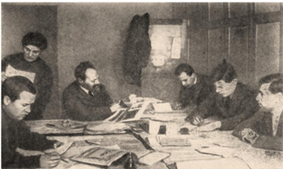
Сотрудники отдела «Рабочая жизнь» газеты «Гудок». Юрий Олеша второй слева.

Псевдоним молодой человек себе взял крайне звучный – «Зубило».