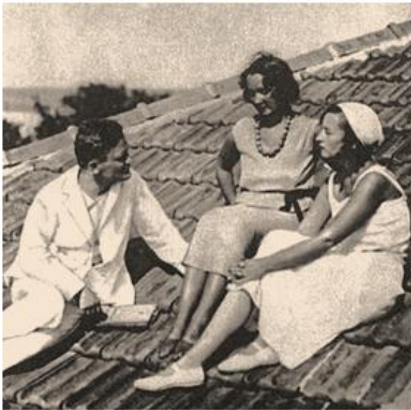
Юрий Олеша, Ольга и Серафима Суок. 1930.