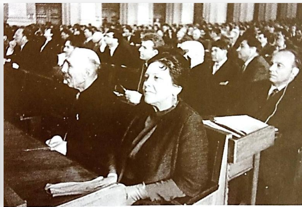
VI Всесоюзный съезд писателей. Москва. 1967 г.