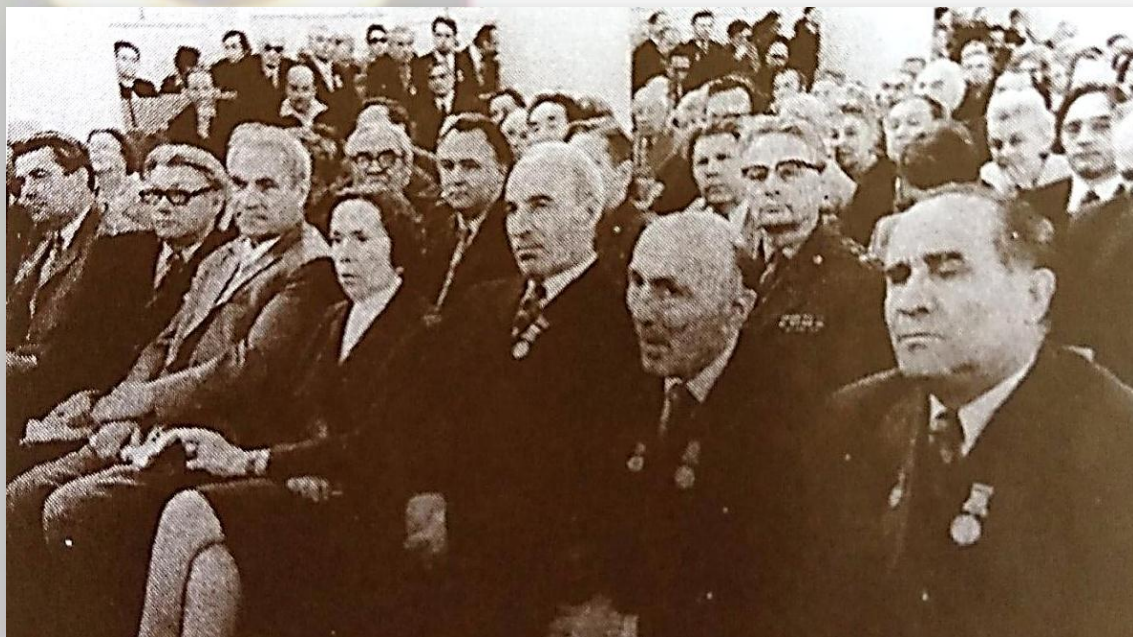
Юбилейный Пленум Союза писателей СССР, посвященный 40-летию I съезда писателей СССР. Москва. 1974 г.